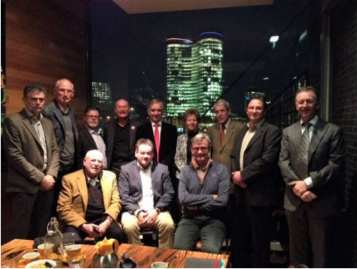
Cofinanciering & PPS.

initiatieven en projectleiders (32 deelnemers), waar presentaties werden gegeven over kredietanalyse, -verlening en –beheer, riskmanagement, governance en compliance, de praktijk van Kredietunie Eemsregio en