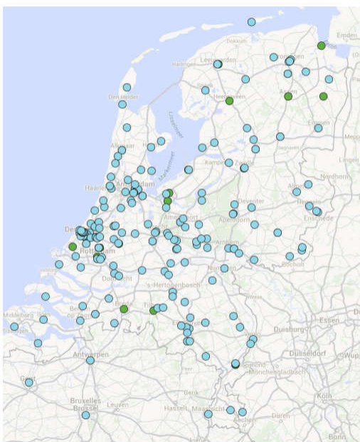
Stand 31 december 2015; 198 aanvragen, 19 opgericht

We hebben deze contacten in een kaart van Nederland weergegeven: http://bit.ly/10iXCtM