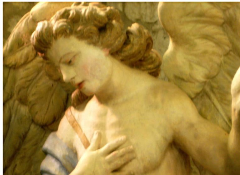
© G.M.Bakker, Detail of sculpture in Eglise de Saint Didier de Clermont en Argonne, France.

Association of Credit Unions in the Netherlands Mesdagstraat 57, 2596XV The Hague www.dekredietunie.nl